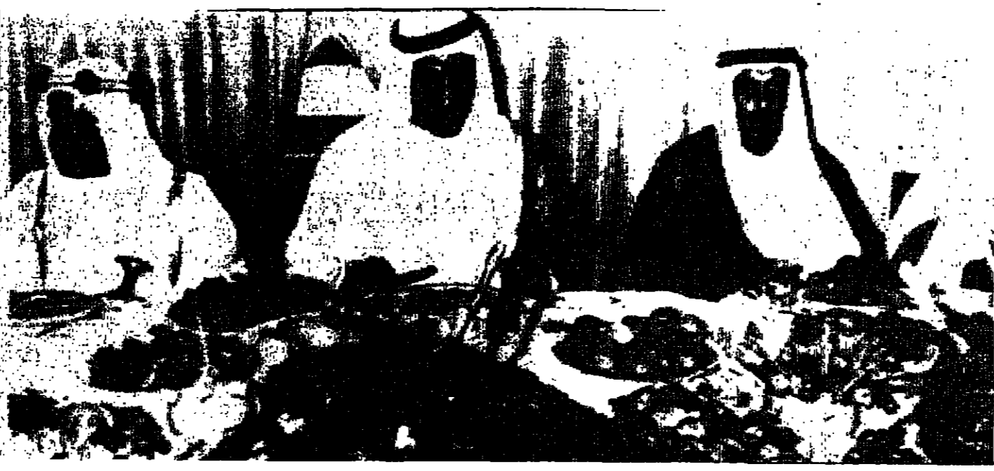
بعض حكم امارات الخليج العربي على مادة غذاء خلال مؤتمرهم في ابو ظبي